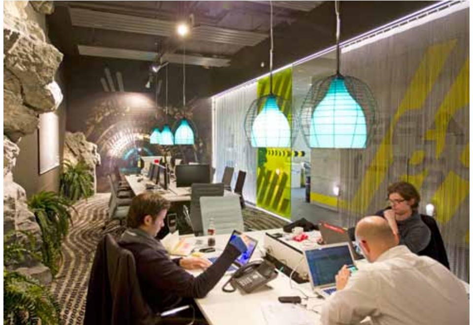
Das Gesamtbild deutet nicht darauf hin, dass mit der erhöhten Zuwanderung Verdrängungseffekte auf dem Schweizer Arbeitsmarkt in bedeutendem Umfang stattgefunden haben. Einzig bei den Hochqualifizierten sind gewisse Anzeichen dafür auszumachen. Im Bild: Mitarbeitende des Google-Entwicklungszentrums in Zürich.

Das Freizügigkeitsabkommen der Schweiz mit der EU/Efta leitete eine Phase starker Zuwanderung in die Schweiz ein. Auch die Zahl der Grenzgänger stieg massiv an. Die Zuwanderungswelle wirft die Frage nach möglichen Verdrängungseffekten für die ansässige Bevölkerung auf dem Arbeitsmarkt auf. Dieser Frage sind die Autoren im Rahmen einer Studie nachgegangen. Im Ergebnis zeigt sich, dass nur geringe Verdrängungseffekte feststellbar sind, dass jedoch einzelne Gruppen etwas stärker betroffen sind als andere. Insgesamt vermochte der Schweizer Arbeitsmarkt die Einführung der Personenfreizügigkeit gut zu verkraften.